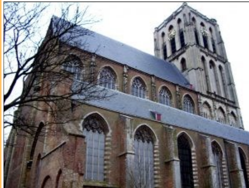
Sint Catharijnekerk Brielle

Aanmelden voor alle activiteiten van de Evenementencommissie bij voorkeur per mail met vermelding van uw naam en telefoonnummer. Mocht u na aanmelding onverhoopt niet mee kunnen, geef dit dan uiterlijk 3 dagen vóór vertrek aan ons door óf bel met Doelen Coach Service, telefoon 06 103 747 24.