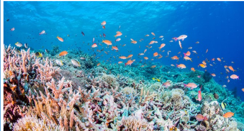
Foto: De ongekende schoonheid van Great Barrier Reef.

Het Reef op Curaçao wordt ook bedreigd en er wordt door de Universiteit Wageningen op aan gedrongen stappen te ondernemen omdat er anders over 15 jaar helemaal geen reef meer is. Er wordt een Deltaplan ontworpen om de overvloedige voedingsstoffen te verminderen. De overige zes Caribische landen die verbonden zijn met Nederland doen mee met dit plan, waarvoor één miljard nodig is om dit doel te verwezenlijken.