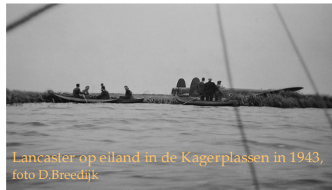
Lancaster op eiland in de Kagerplassen in 1943