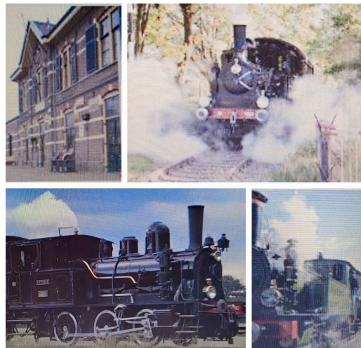
Foto: een impressie van de locomotief die ons gaat vervoeren van Haaksbergen naar Boekelo.