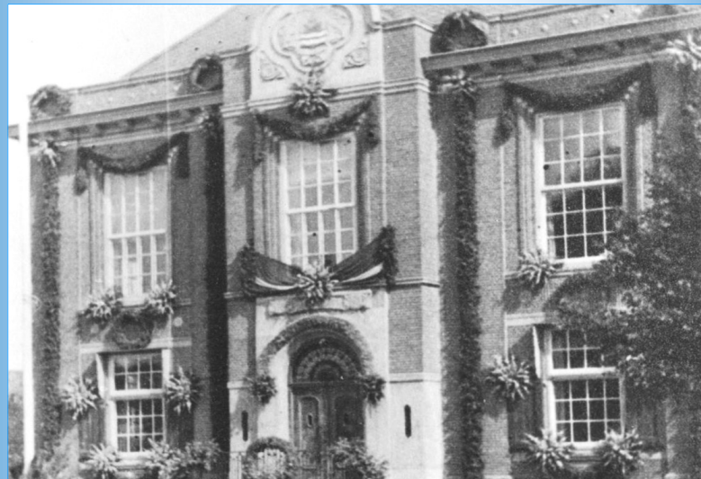
Het VERSIERDE POLDERHUIS in HOOFDDORP tijdens de BEVRIJDINGSFEESTEN in Mei 1945

KBO Haarlemmermeer belangenorganisatie voor senioren